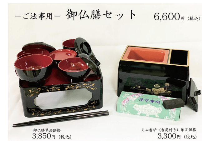
—ご法事用— 御仏膳セット 6,600円(税込)