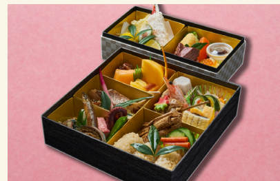
琥珀(こはく)…… 8,640円 (税込)