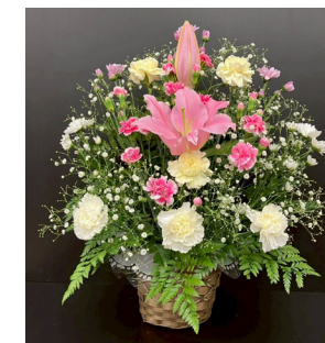
B-6 (お供えアレンジ) 6,600円(税抜 6,000円) [W50cm × H60cm]