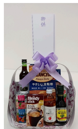
法事用 缶詰・飲料セット 8,640円(税込) 8,000円(税抜)