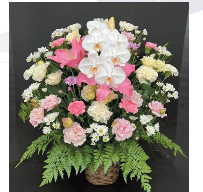
B-10 (お供えアレンジ) 11,000円(税抜 10,000円) [W65cm × H80cm]