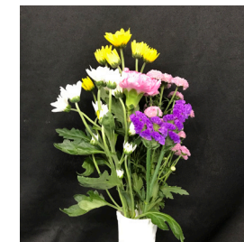
C-1 (お墓用束) 1,100円(税抜 1,000円) [H40cm]