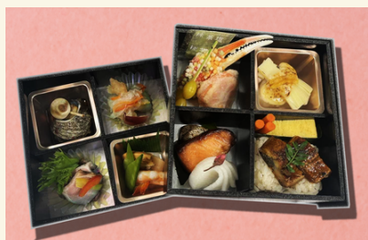
山吹(やまぶき)…… 3,780円 (税込)