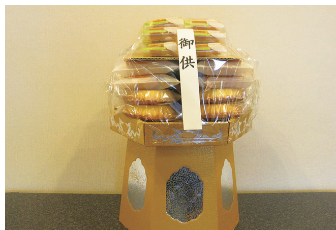
法事用盛菓子 8,640円(税込) 8,000円(税抜)