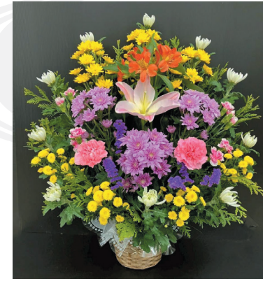
A-8 (法事カゴ) 8,800円(税抜 8,000円) [W60cm × H75cm]