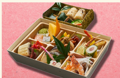
蘇芳(すおう)…… 6,480円 (税込)