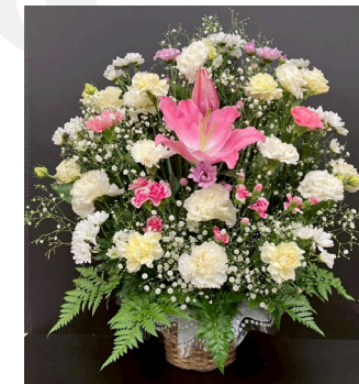
B-8 (お供えアレンジ) 8,800円(税抜 8,000円) [W60cm × H70cm]