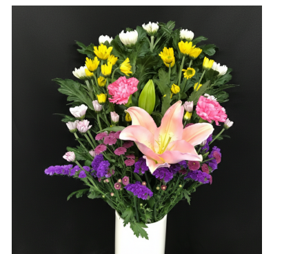
C-5 (お供え用仏東) 5,500円(税抜 5,000円) [H70cm]