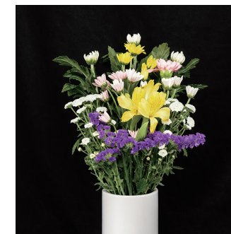
C-3 (お供え用仏東) 3,300円(税抜 3,000円) [H55cm]