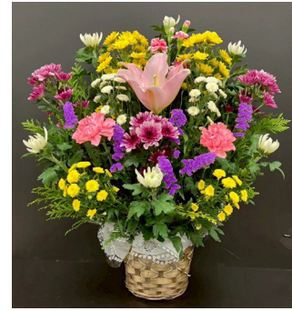
A-6 (法事カゴ) 6,600円(税抜 6,000円) [W50cm × H65cm]