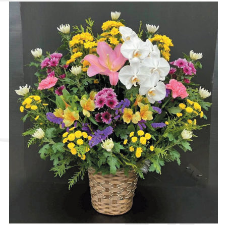
A-10 (法事カゴ) 11,000円(税抜 10,000円) [W70cm × H80cm]